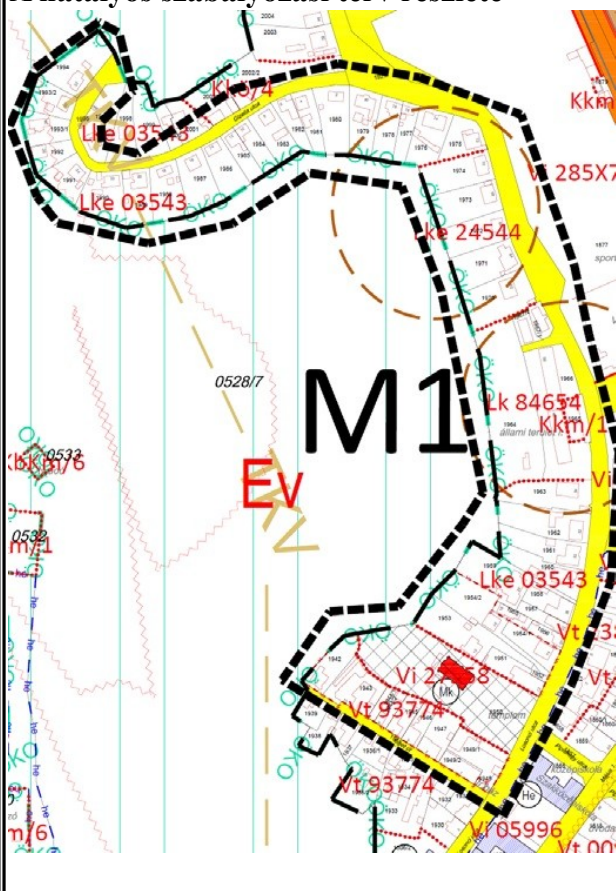
1.1. ábra Szabályozási tervlap hatályos Kd4 szelvény - kivonat, részlet